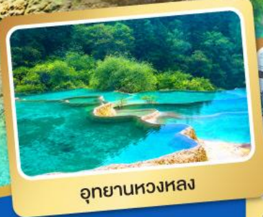
อุทยานหลวงหลง