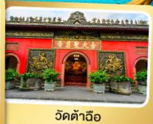
วัดต้าฉือ